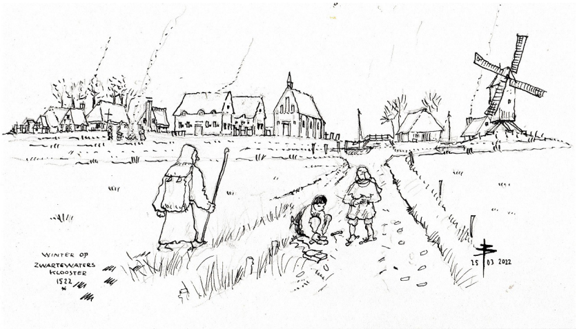
Tekening: Bernard Bos